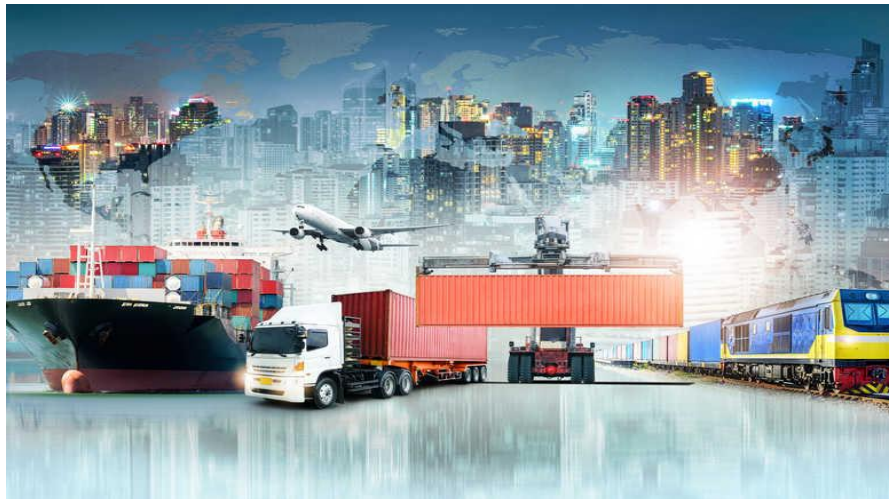
Hình 1.3: Ảnh minh họa